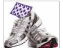
Freshen up shoes