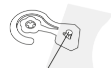
Place sachet over peg on hook

Each 35g sachet measures: 13 x 10cm (5"x 4") Pack contains 8 sachets.