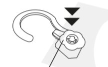
Press firmly to secure sachet ready for hanging