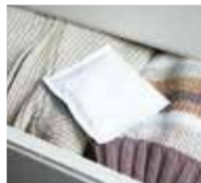
Place in drawers