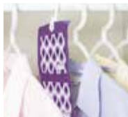
Hang in wardrobes